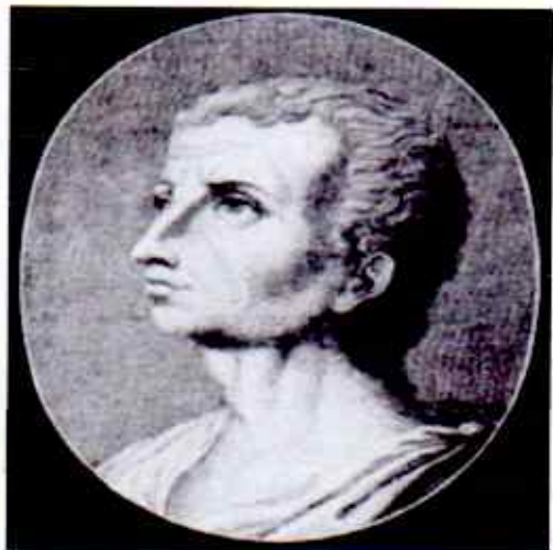
Tite-Live (en latin : Titus Livius ), dit « Le Padouan », né en 59 av. J.-C. ou en 64 av. J.-C. et mort en l'an 17. dans sa ville natale de Padoue ( Patavium en latin), est un historien de la Rome antique, auteur de la monumentale œuvre de l' Histoire romaine ( Ab Urbe condita libri : AUC).

Cette légende a eu plusieurs auteurs comme Virgile.